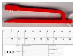
cartellino/testimone e punzone