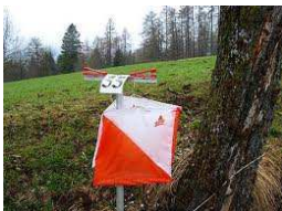
punto di controllo/lanterna

La gara è a sequenza libera: il tragitto e la sequenza con cui passare dai vari punti sono liberi, ogni concorrente mette in atto la tattica preferita.